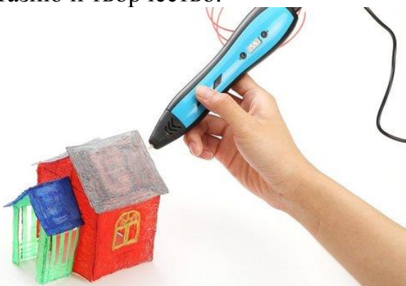
Рис. 1. Работы с 3D ручкой.

- Работа с 3D ручкой. С помощью такой ручки обучающиеся могут создавать различные геометрические фигуры, украшения, цветы и любые объемные фигуры разной сложности (рис. 1). Обучающимся очень интересна такая работа, где можно проявить фантазию и творчество.