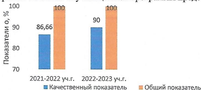
Рисунок 2. Уровень освоения обучающимися программы

Наглядно динамика уровня освоения обучающимися программы представлена на рисунке 2.